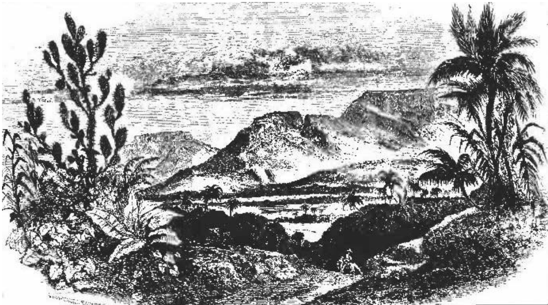
Um Trecho das Caatingas