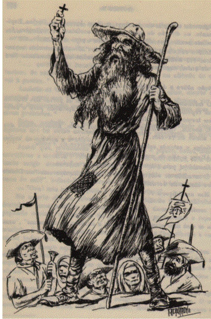
Gravura de Antonio Conselheiro