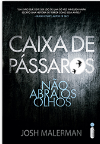
Caixa de pássaros Josh Malerman