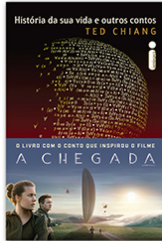
História da sua vida e outros contos Ted Chiang