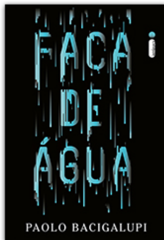
Faca de água Paolo Bacigalupi