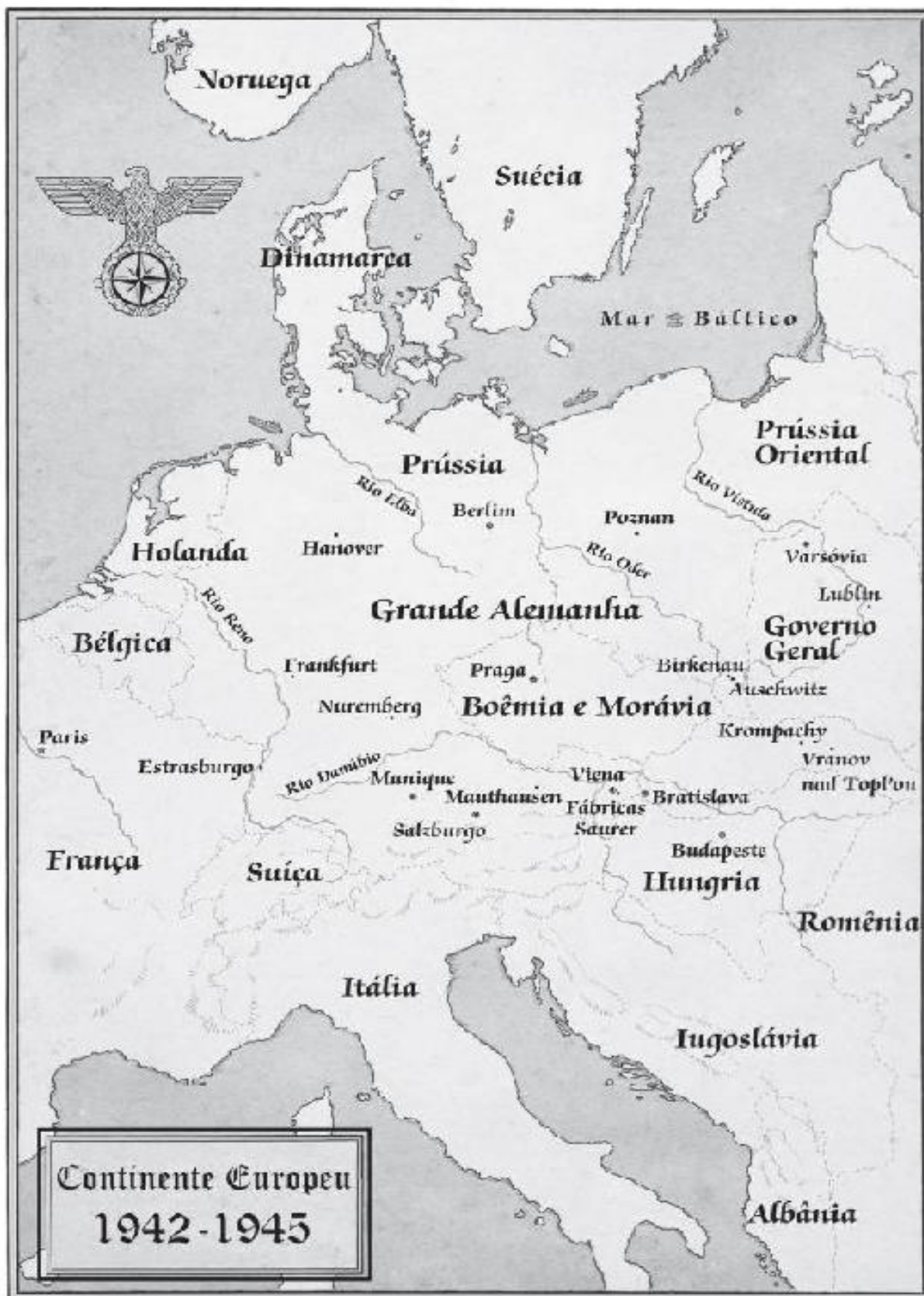
Continente Europeu 1942-1945