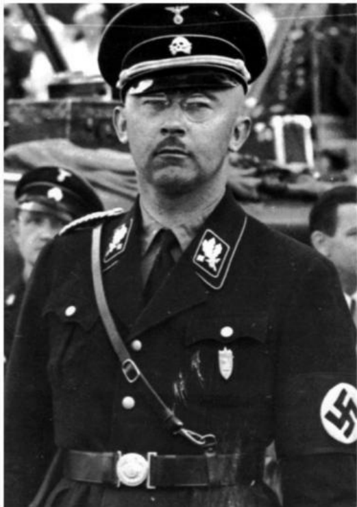
Heinrich Himmler, o líder da SS que conduziu o genocídio e ajudou a traçar o plano para seqüestrar o papa. Ao mesmo tempo, flertava com a idéia de