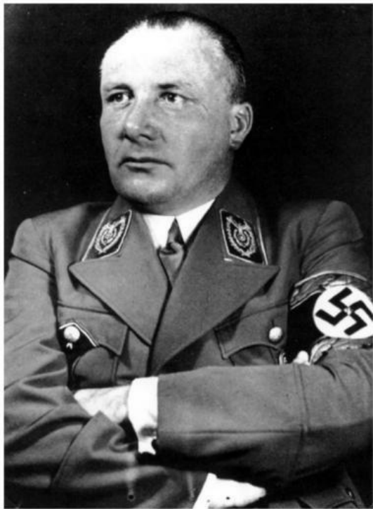
Martin Bormann, cujo nome não era muito conhecido nem mesmo da maioria dos alemães, tornou-se o conselheiro mais influente de Hitler e passou anos pensando em seqüestrar o papa. Esse seria o primeiro passo para destruir o