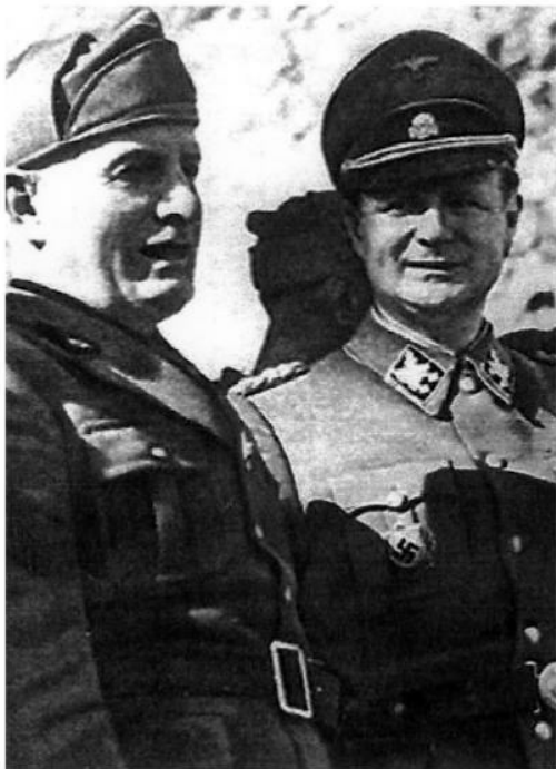
O general da SS Karl Wolff com o ditador italiano Benito Mussolini. Wolff, como chefe da SS na Itália, era responsável por assegurar a lealdade do Duce a Hitler após o italiano ter sido deposto e fugido, com a ajuda dos nazistas, para o norte da