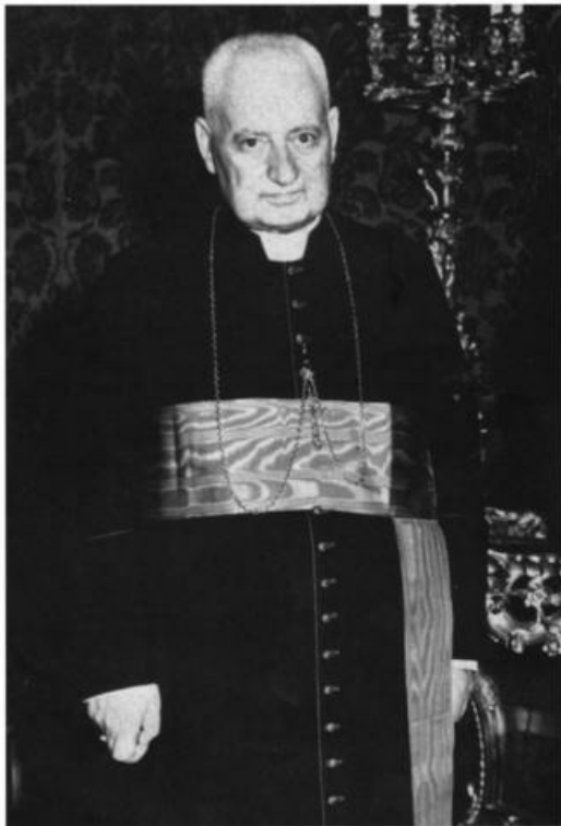
Cardeal Luigi Maglione, secretário de Estado do Vaticano. Ele advertiu o