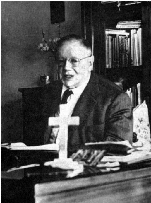
Israel Zolli, rabino-chefe de Roma, atravessou sorrateiramente a cidade infestada de nazistas e foi ao Vaticano. Fingindo ser construtor, desejava pedir ouro ao papa com o objetivo de conseguir o resgate exigido pela Alemanha para que o país não deportasse os judeus de Roma. A maioria deles foi salva, em parte