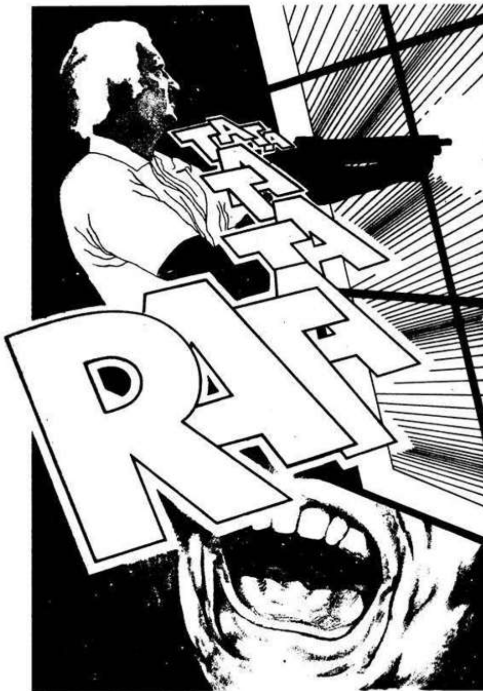
Arrancando lascas do muro, os disparos de Hildebrando atemorizaram o intruso.