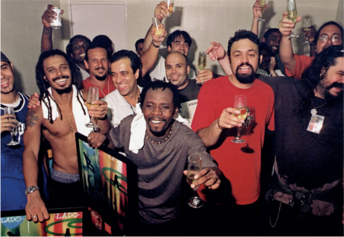
Comemoração no camarim quando O Rappa recebeu o disco de ouro pelas vendas de Lado B Lado A (1998).