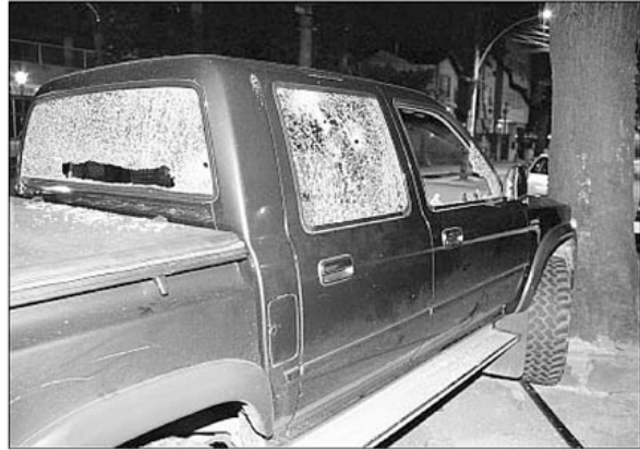
O CARRÃO DO músico, com os vidros estilhaçados: mais de 15 disparos dados por oito homens armados