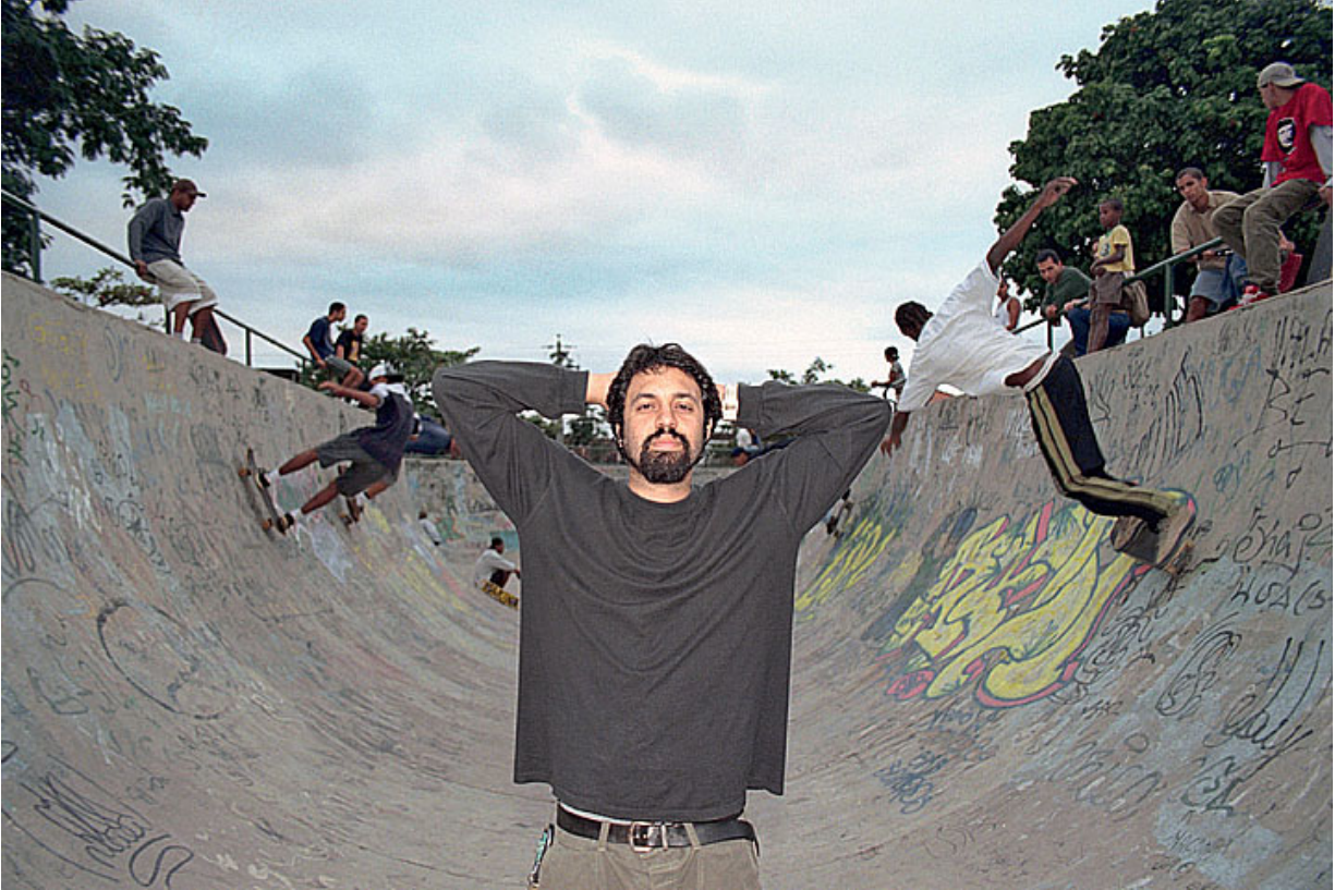
... na pista de skate do bairro.