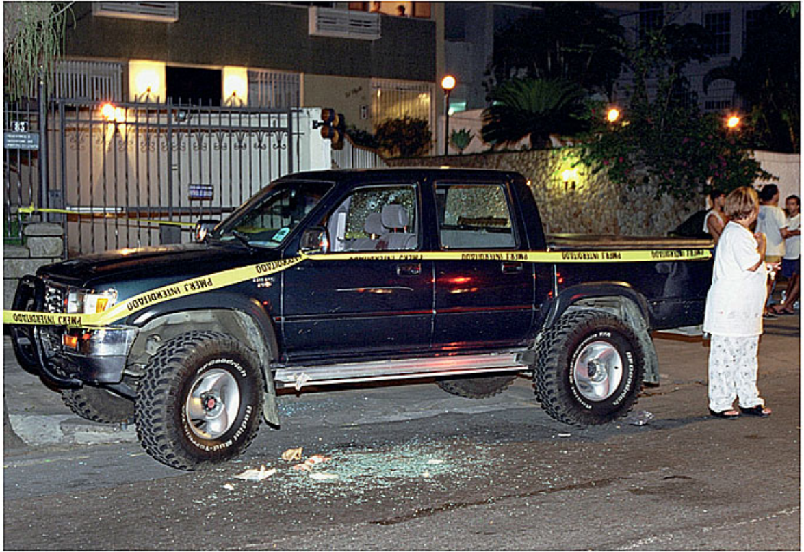
O carro de Yuka no local do tiroteio. O artista foi atingido por nove tiros.