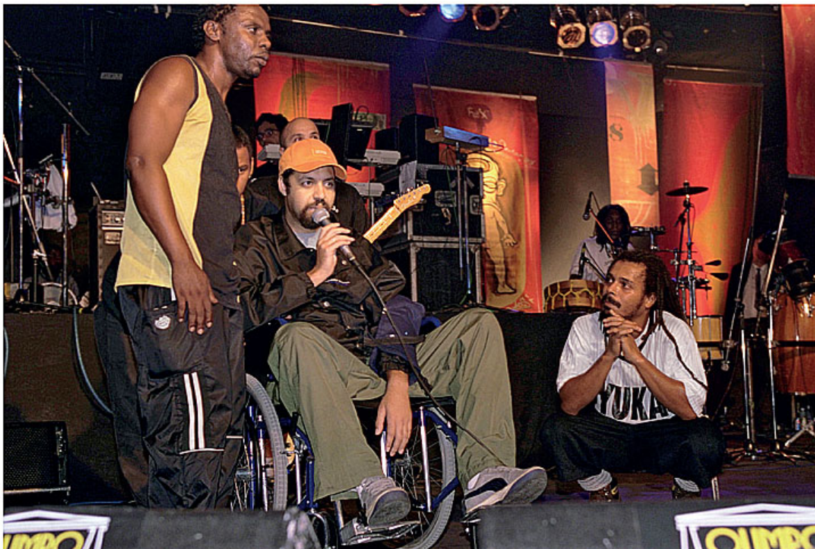
Na casa de shows Olimpo, numa nova tentativa de dividir o palco com O Rappa, em dezembro de 2000.