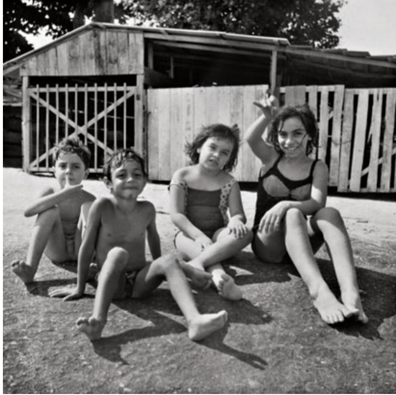
Brincando com os vizinhos em Campo Grande, onde passou a infância.