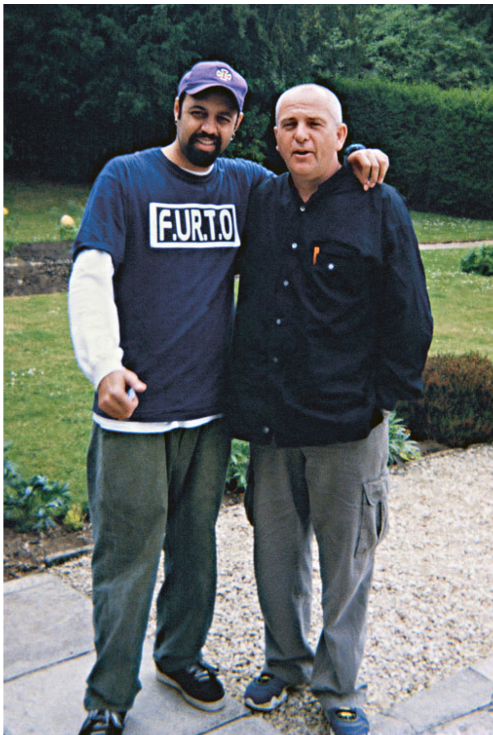
Com Peter Gabriel, em 1998, nos jardins do estúdio Real World (Wiltshire, Inglaterra), de propriedade do artista inglês, durante as mixagens do disco Lado B Lado A, d'O Rappa.