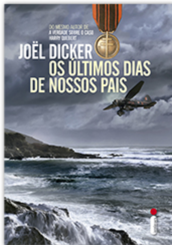
Os últimos dias de nossos pais