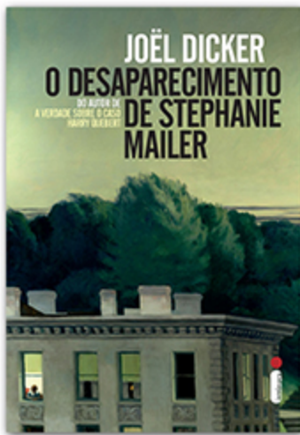
O desaparecimento de Stephanie Mailer