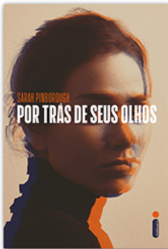
Por trás de seus olhos Sarah Pinborough