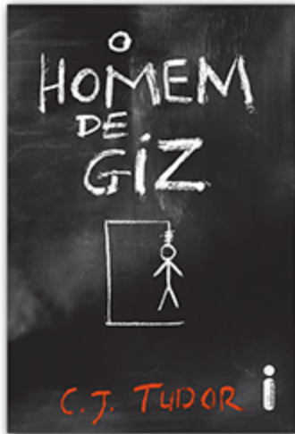
O homem de giz C. J. Tudor