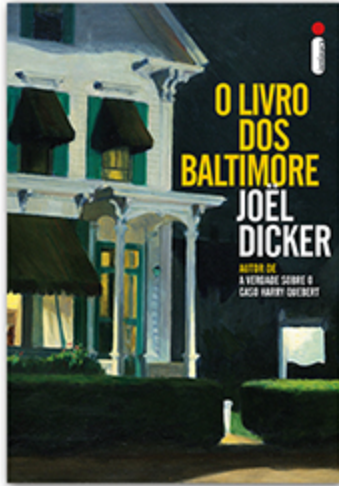
O livro dos Baltimore