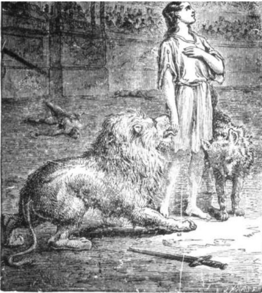
Os Mártires do Coliseu Os Mártires do Coliseu Os Mártires do COLISEU