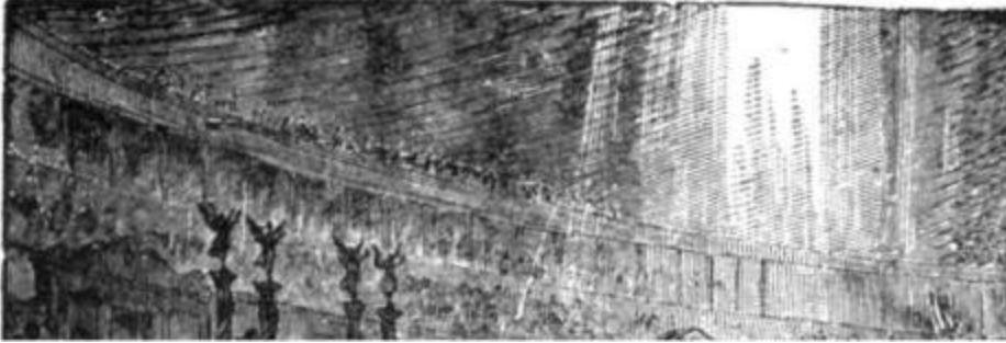
Os Mártires do Coliseu Os Mártires do