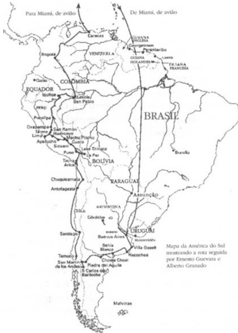
Mapa da América do Sul mostrando a rota seguida por Ernesto Guevara e Alberto Granado