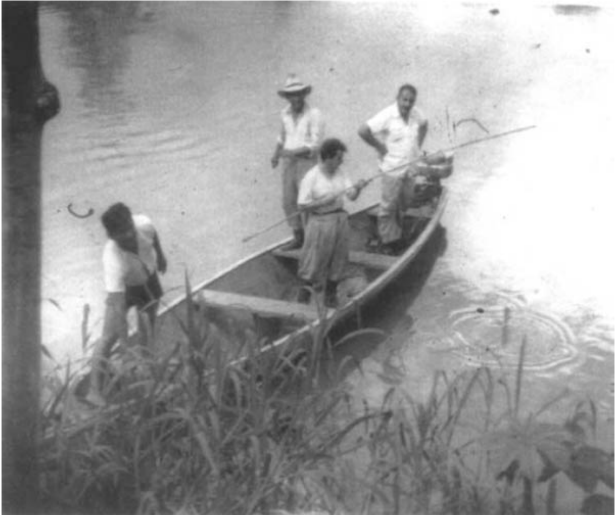
Granado e a equipe do leprosário de San Pablo pescando no rio Amazonas. Foto de Ernesto Che Guevara.