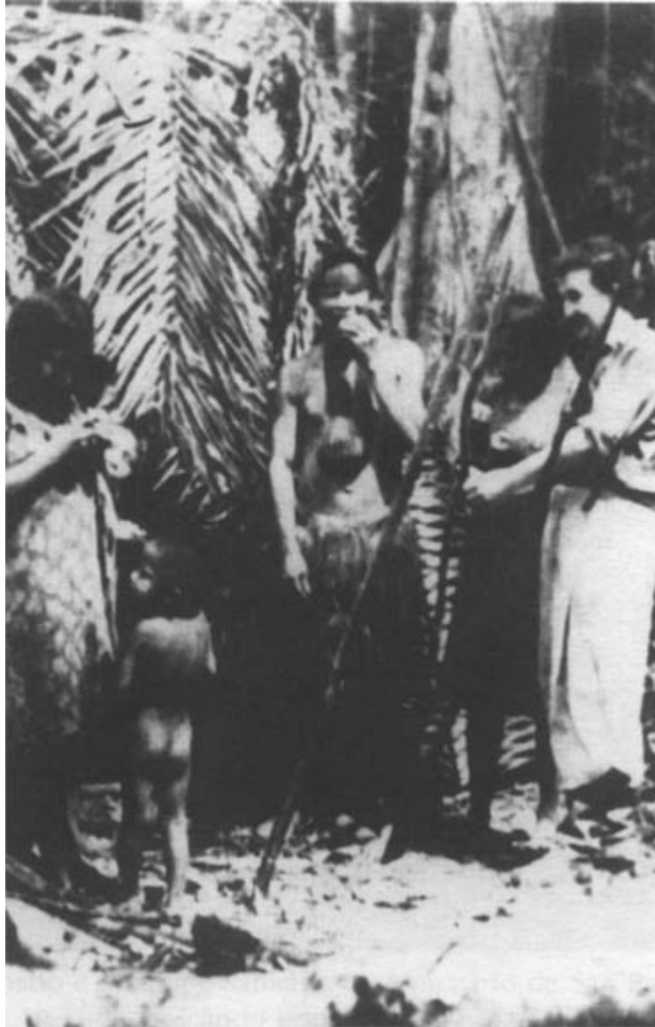
Granado e índios Yaguá, próximo ao leprosário de San Pablo.