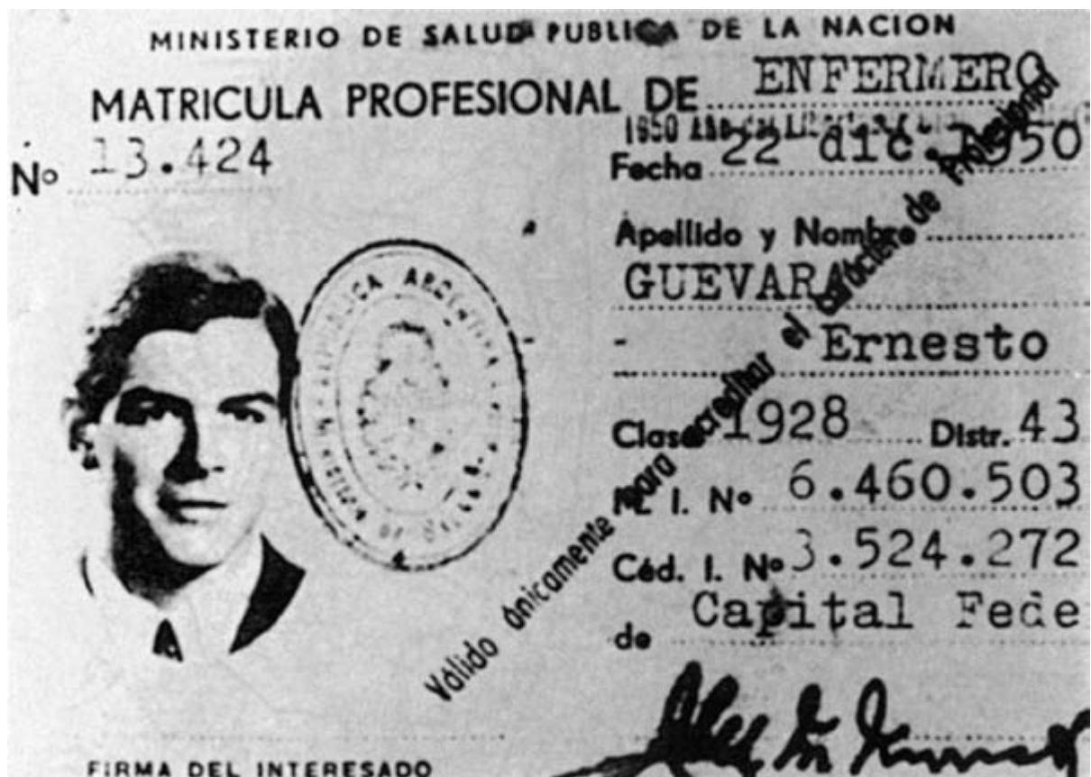
Reprodução da carteira profissional de enfermeiro de Ernesto Che Guevara (1950).