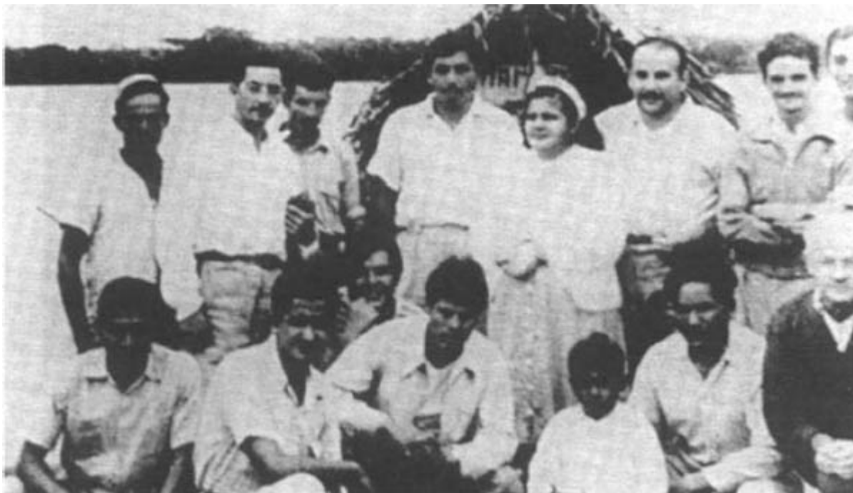
Ernesto Che Guevara, o terceiro à esquerda, agachado, no Mambo-Tango , com alguns doentes de lepra e médicos do leprosário de San Pablo, Peru.