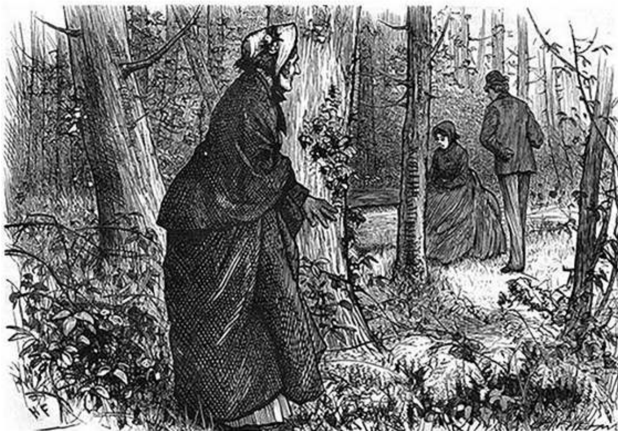
Curvando-se sobre a grama orvalhada, a Sra. Sparsit aproximou-se.