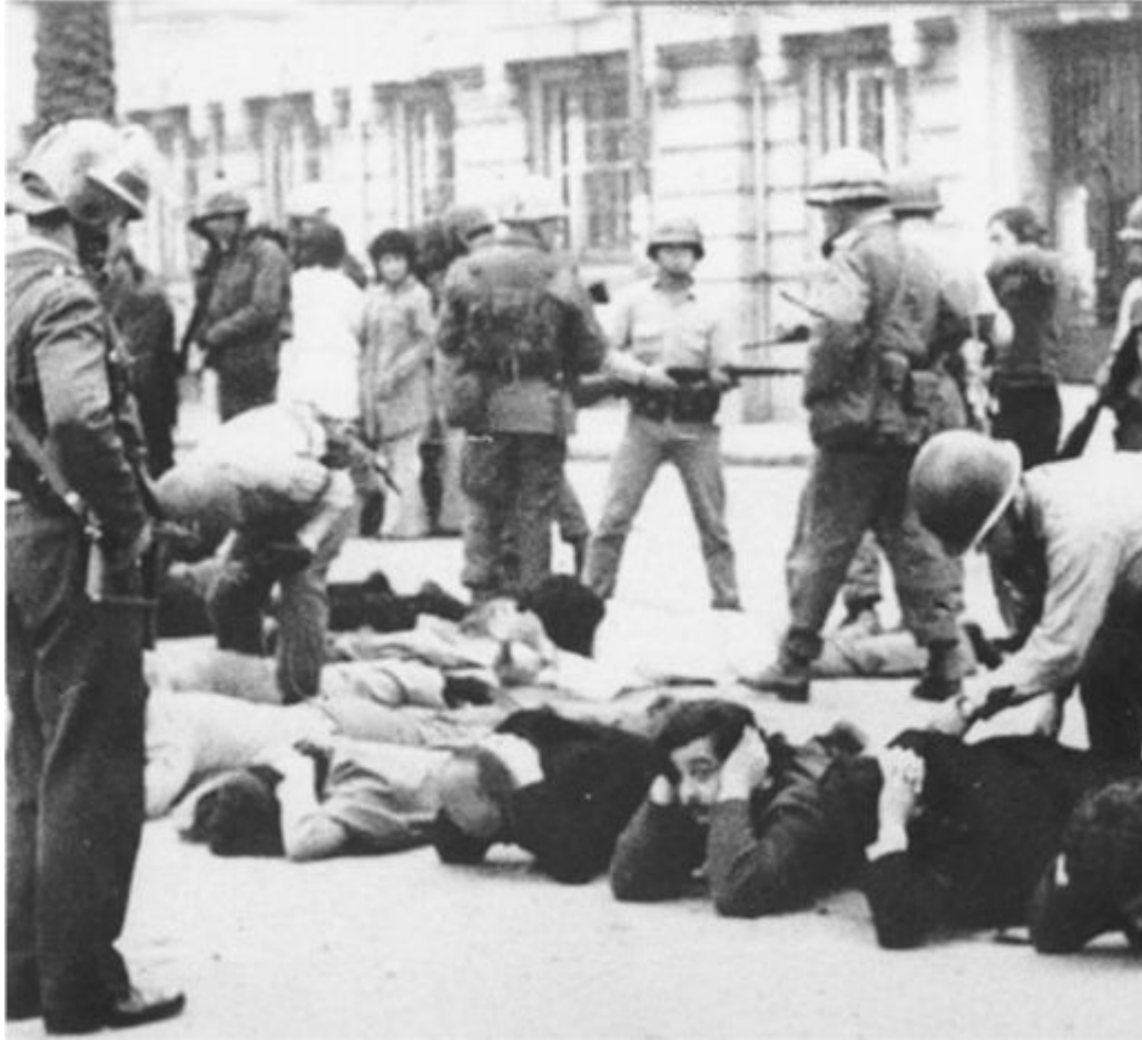
9. Policiais e soldados do Exército detêm partidários de Allende em Santiago.