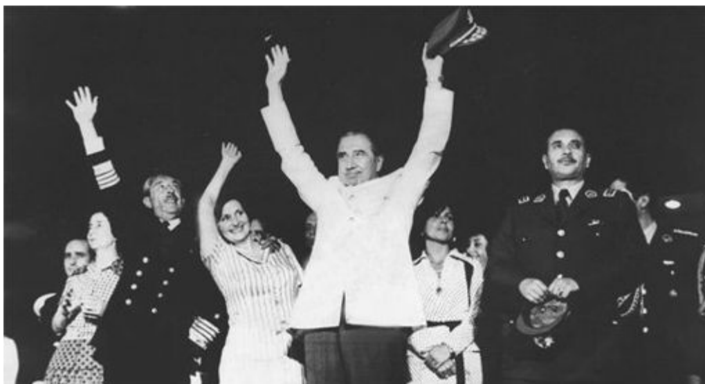
17. Augusto Pinochet e sua esposa saúdam a multidão de partidários na celebração da vitória do "Sim" no referendo de 1978.