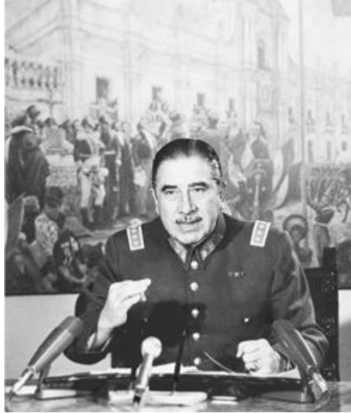
1. Pinochet fala à nação no Palácio de la Moneda.