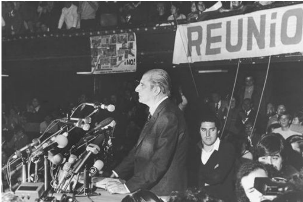
18. O ex-presidente Eduardo Frei fala num comício de oposição ao plebiscito de 1980 sobre uma nova Constituição. Heraldo Muñoz estava presente no teatro.