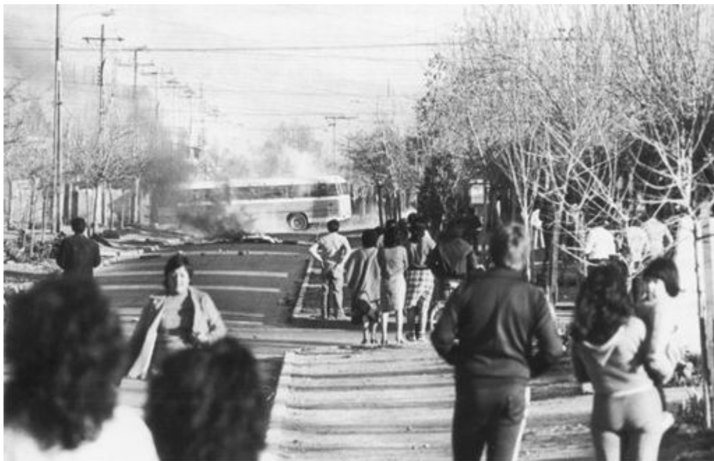
19. Um ônibus incendiado é usado como barricada durante os protestos contra a ditadura de Pinochet, num bairro popular de Santiago, em 12 de julho de 1983.