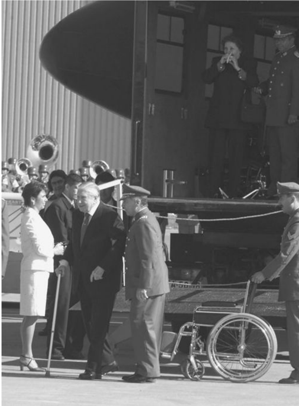
34. Depois da detenção em Londres, Augusto Pinochet chega ao Aeroporto Internacional de Santiago. Libertado por motivos de saúde, ele se levanta e anda normalmente.