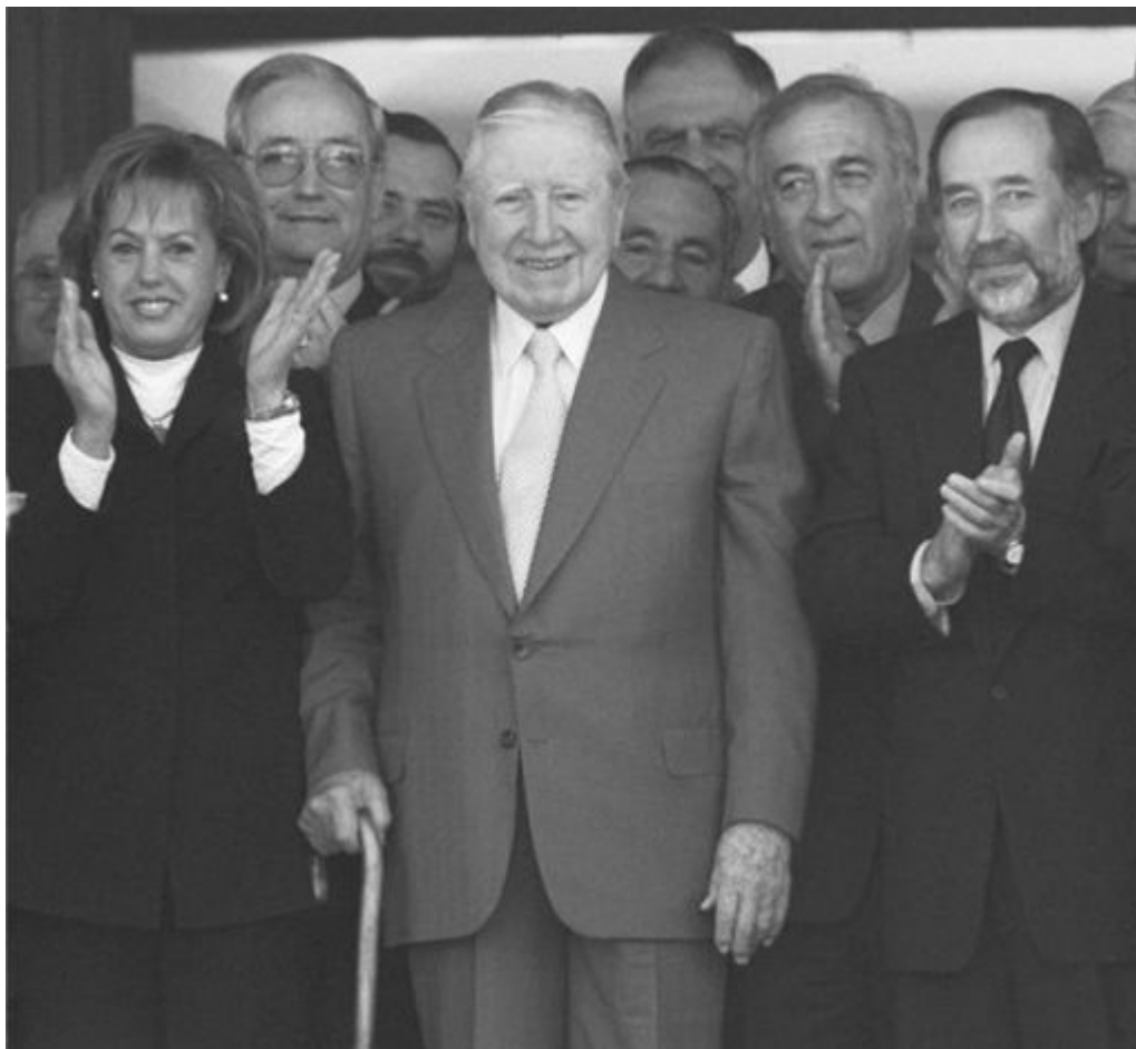
35. Augusto Pinochet sorri ao receber partidários do Congresso à entrada de sua casa nos arrabaldes de Santiago, em 9 de agosto de 2000. O ex-ditador acabara de perder a imunidade para enfrentar o julgamento por abuso contra os direitos humanos.