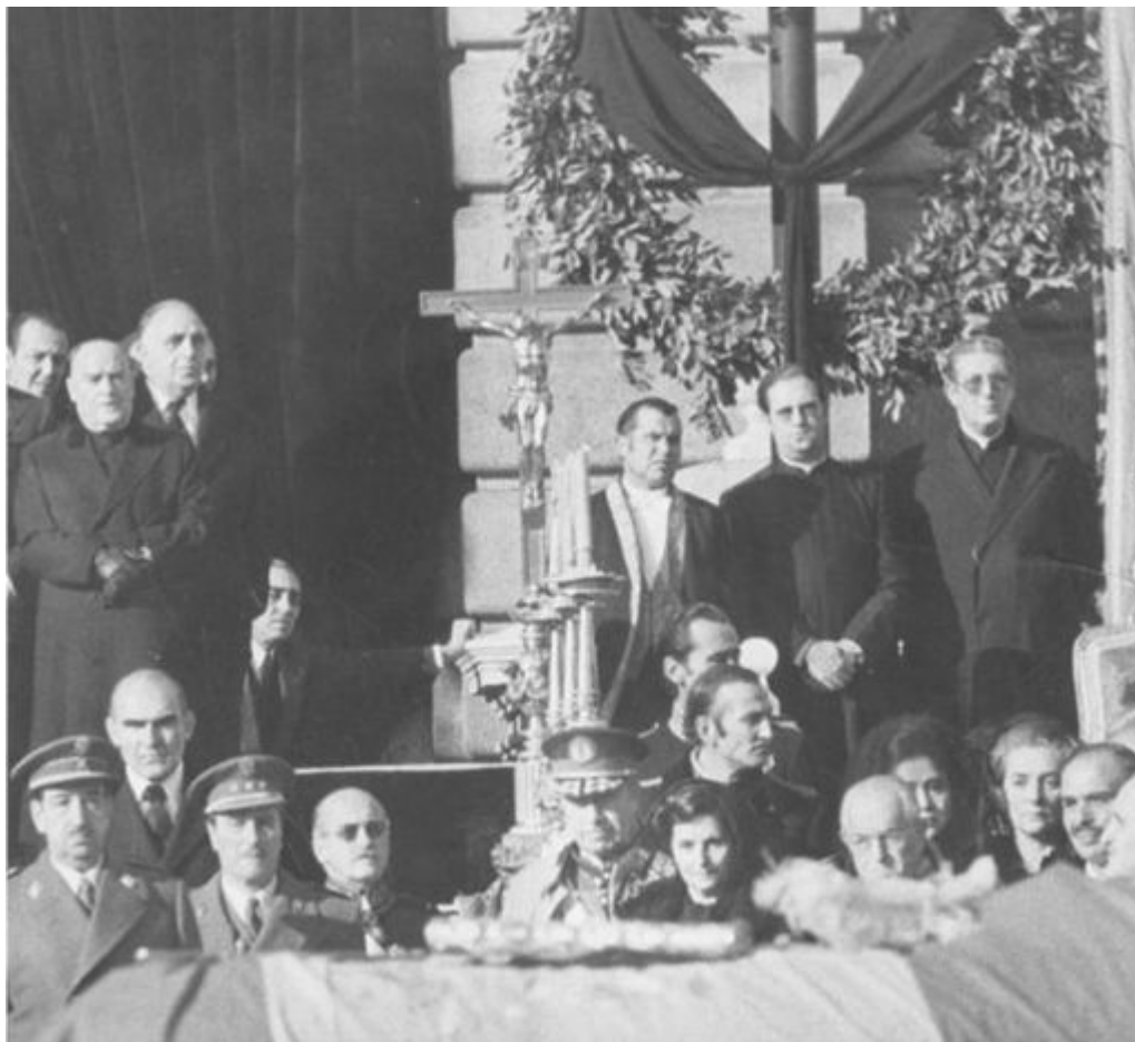
28. Em Madri, em novembro de 1975, Pinochet de pé ao lado do caixão de Francisco Franco, coberto pela bandeira espanhola. O ditador chileno está rodeado por oficiais militares e guardas de segurança.