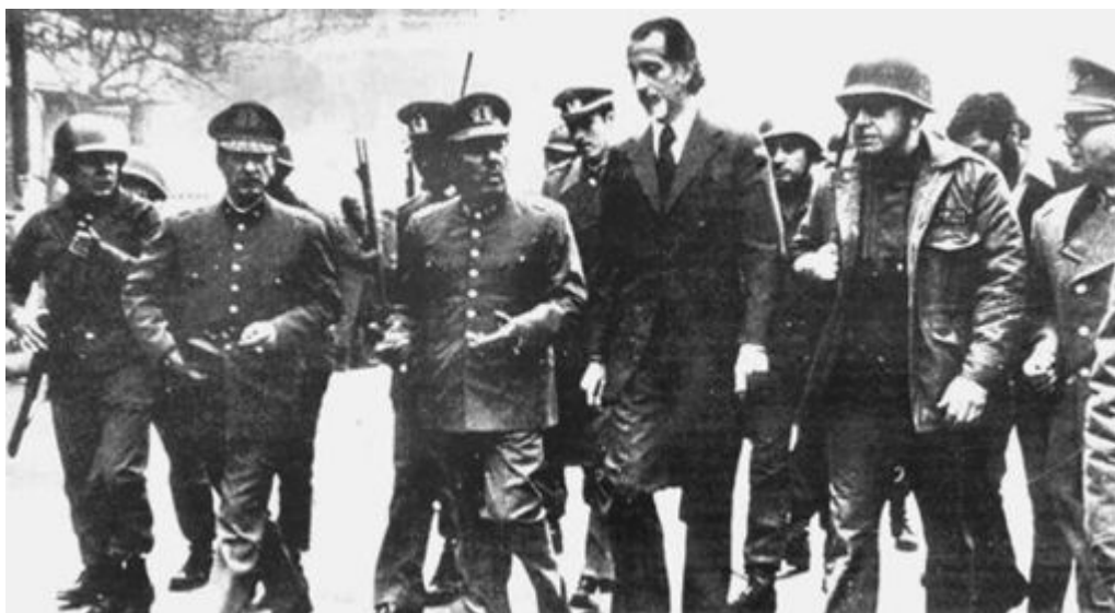
4. O ministro do Interior de Allende, José Tohá, ladeado pelo comandante do Exército, Carlos Prats, e pelo general Augusto Pinochet (em traje de combate e óculos escuros), durante o putsch fracassado conhecido como Tanquetazo, cerca de três meses antes do golpe. Pinochet só apareceu depois que Prats já havia controlado a rebelião.