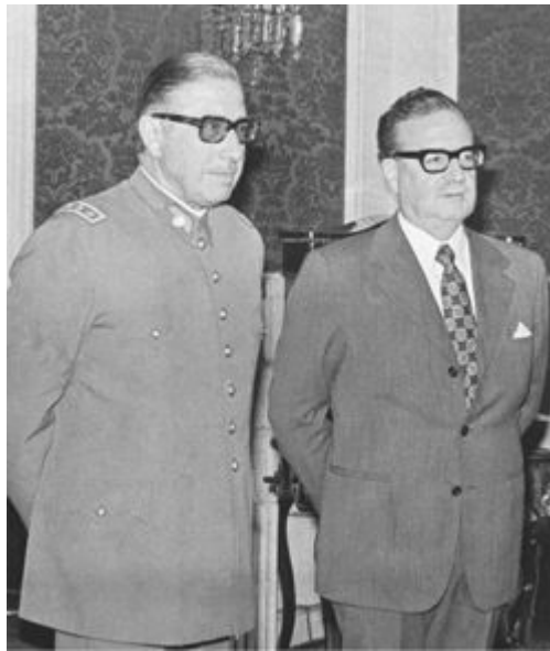
2. O general Augusto Pinochet e Salvador Allende durante a cerimônia em que o presidente o nomeou comandante em chefe do Exército, em 23 de agosto de 1973. Dezoito dias depois, Pinochet derrubaria o governo Allende.