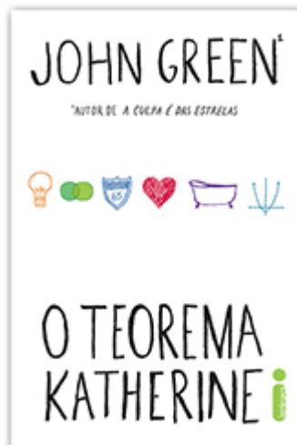
O Teorema Katherine