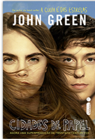
Cidades de papel