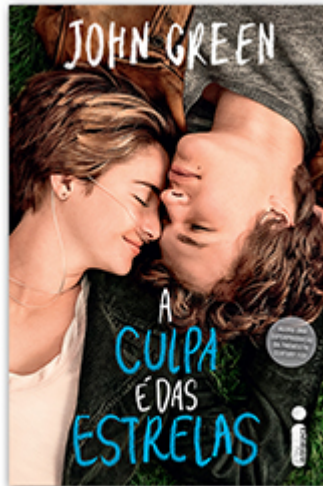
A culpa é das estrelas