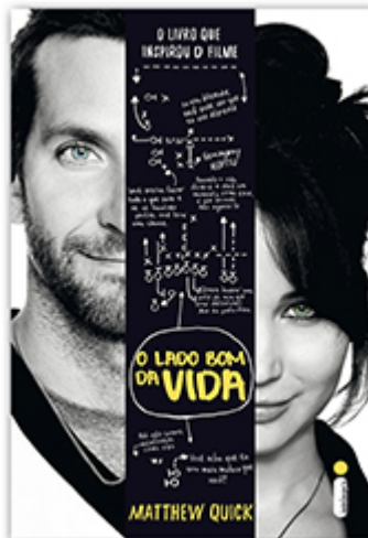
O lado bom da vida Matthew Quick