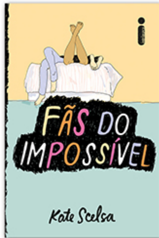
Fãs do impossível Kate Scelsa