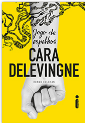
Jogo de espelhos Cara Delevingne