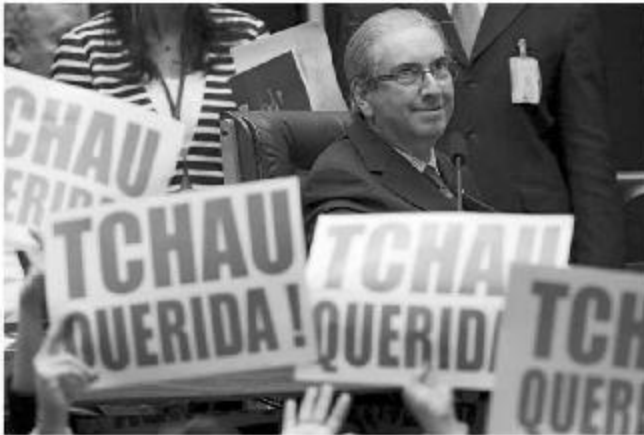
Acima, à esquerda, reprodução de capa da revista Veja, retratando a tomada de poder pelo PMDB, no momento em que Temer era alçado a coordenador político de Dilma. Acima, à direita, o deputado Marco Feliciano, ícone anti-PT, na sessão de impeachment (reprodução Facebook). Abixo, Cunha cercado de cartazes "Tchau querida", na sessão de impeachment.