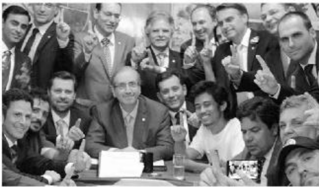
Em cima, em abril de 2015, Dilma condeceoa Eduardo Cunha. Embaixo, Eduardo Cunha recebe o pedido de impeachment dos movimentos populares, com a presença de então deputado Jair Bolsonaro (reprodução Facebook).