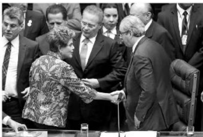
Acima, foto da votação do impeachment na sessão de 17 de abril, sob o comando de Cunha. Abaixo, Eduardo Cunha recebe Dilma, juntamente com Renan Calheiros, na abertura do ano legislativo de 2016, depois da autorização de abertura do processo de impeachment.