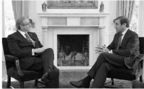
Em Portugal, com o primeiro ministro, Pedro Passos Coelho, em encontro no qual se criticou a Dilma frente a situação da economia.