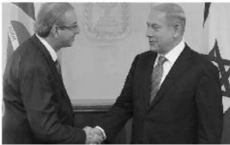
Em Israel, com Benjamin Netanyahu.