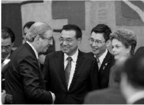
Eduardo Cunha, junto com Dilma, cumprimenta o primeiro-ministro da China, Li Keqiang.