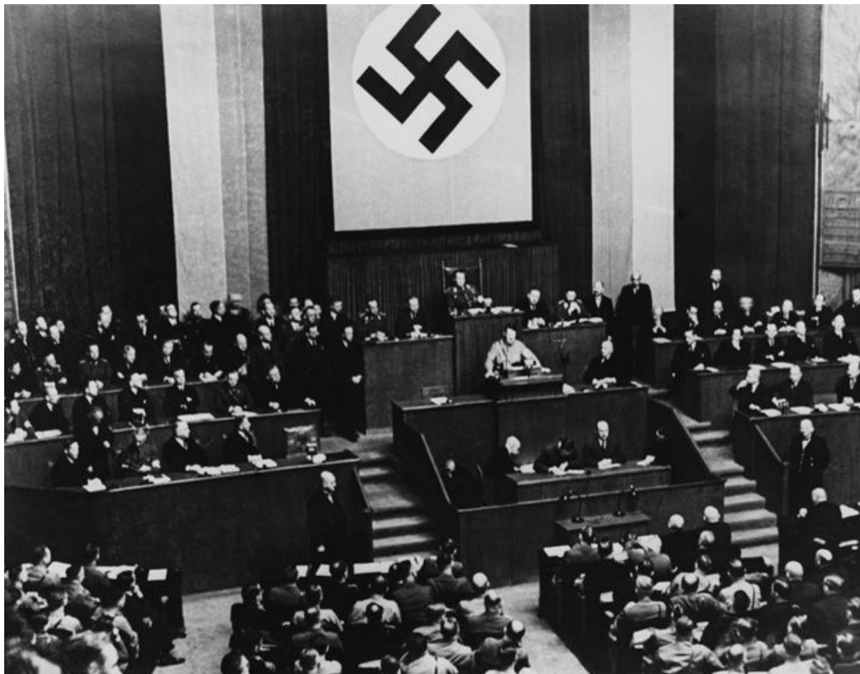
Hitler dissolve o Reichstag em 23 de março de 1933.

democratas uma última vez e disse-lhes que não queria sequer que votassem a lei. “A Alemanha deve ser livre”, ele berrou, “mas não através de vocês!”. 362