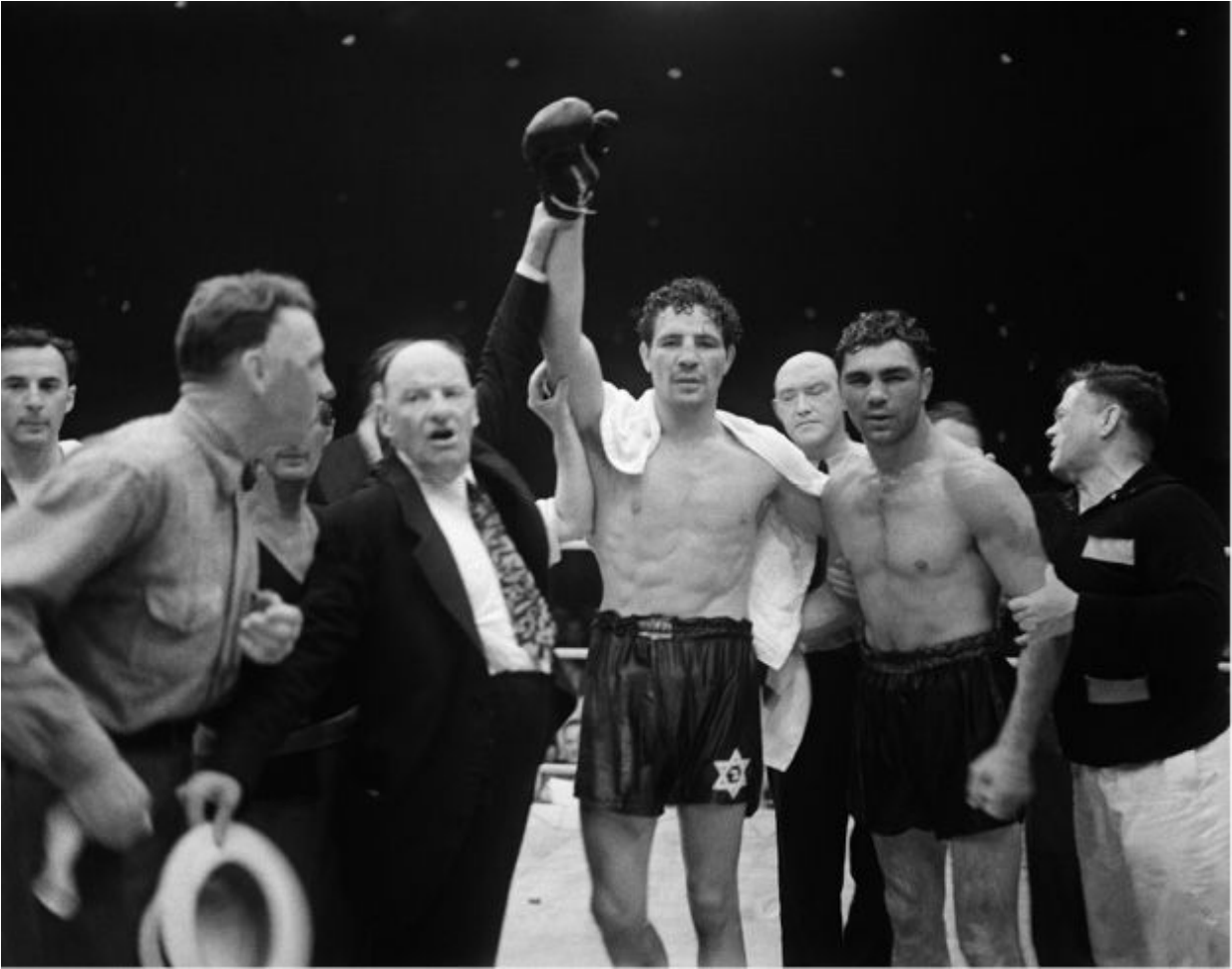
Max Baer (centro) imediatamente após derrotar Max Schmeling (segundo a partir da direita), em 8 de junho de 1933. A Estrela de Davi está costurada no calção de Baer.

A vitória de Baer transformou-o num herói, e logo depois ele recebeu uma tentadora proposta de Louis B. Mayer, da MGM, que lhe ofereceu US$ 30 mil para estrear um grande filme sobre um campeão mundial de boxe dos pesos-pesados, intitulado The Prizefighter and the Lady [O Pugilista e a Favorita]. 480 O filme foi rodado em setembro e outubro, e em 10 de novembro estreou nos Estados Unidos. Mostrava Baer vencendo combates de boxe e tendo romances com lindas mulheres, e foi um grande sucesso. 481