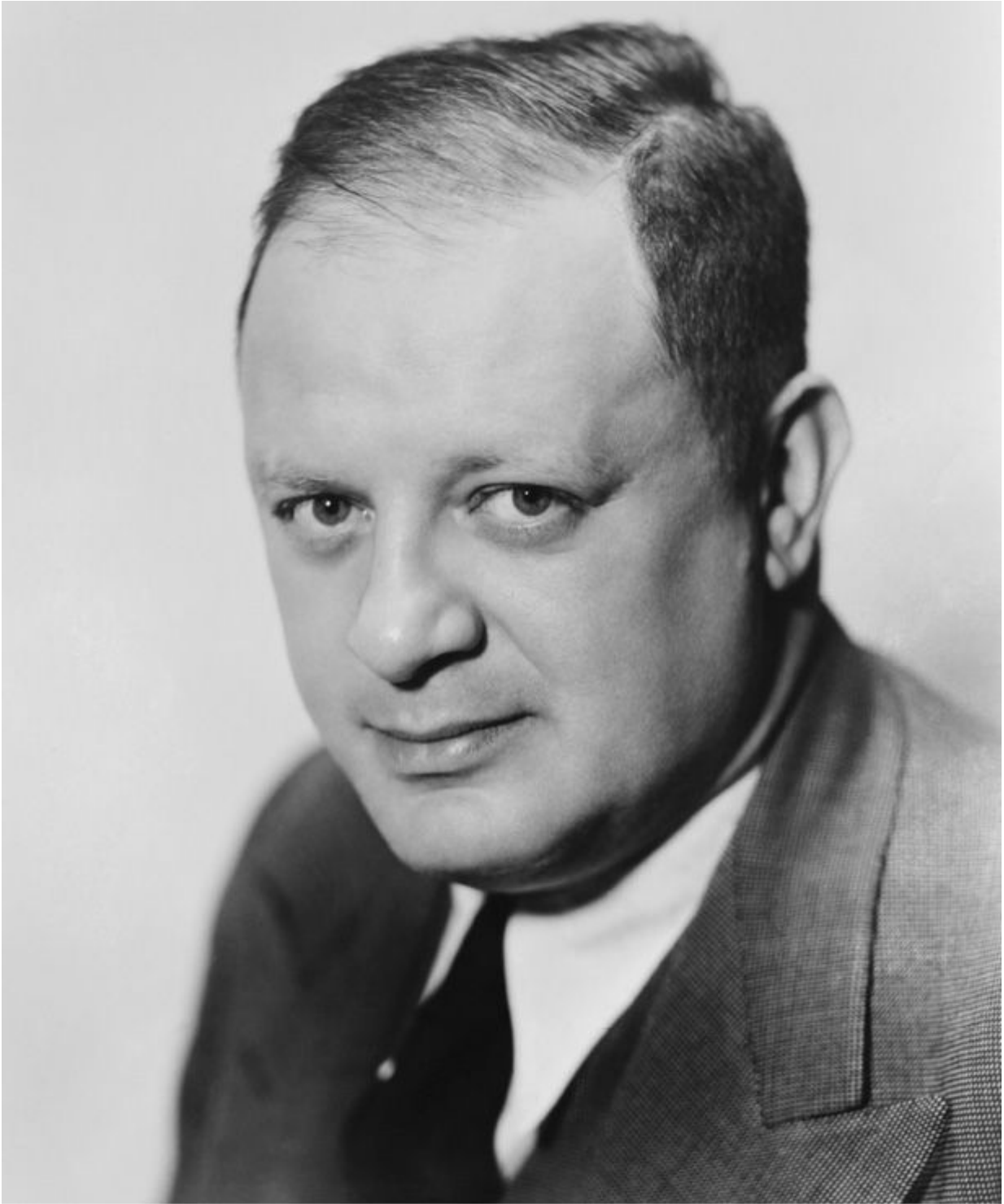
Herman J. Mankiewicz, autor de The Mad Dog of Europe e de Cidadão Kane.