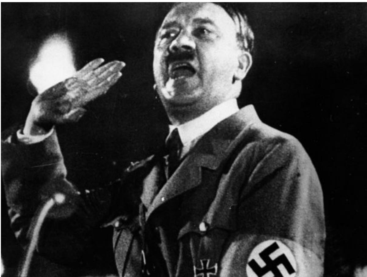
A capacidade oratória de Hitler em ação.

grita ele. "Os Estados Unidos da América são uma democracia! Não estamos prontos para abrir mão do governo de nossos pais!"