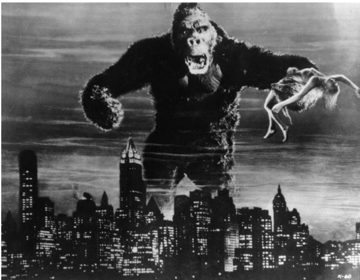
Pôster promocional do filme King Kong (1933).

E assim, em vez de examinar os problemas óbvios com King Kong , a comissão simplesmente voltou à questão original de se o filme poderia ser considerado prejudicial à saúde dos espectadores normais. Zeiss havia dito que King Kong era "um ataque aos nervos do povo alemão" e se referido a imagens particulares que segundo ele tinham um efeito danoso, mas não conseguira dar qualquer justificativa para o seu enfoque. A comissão, portanto, rejeitou seu depoimento e achou que "o efeito geral desse típico filme americano de aventura no espectador alemão é meramente prover entretenimento kitsch , de modo que não se pode esperar nenhum