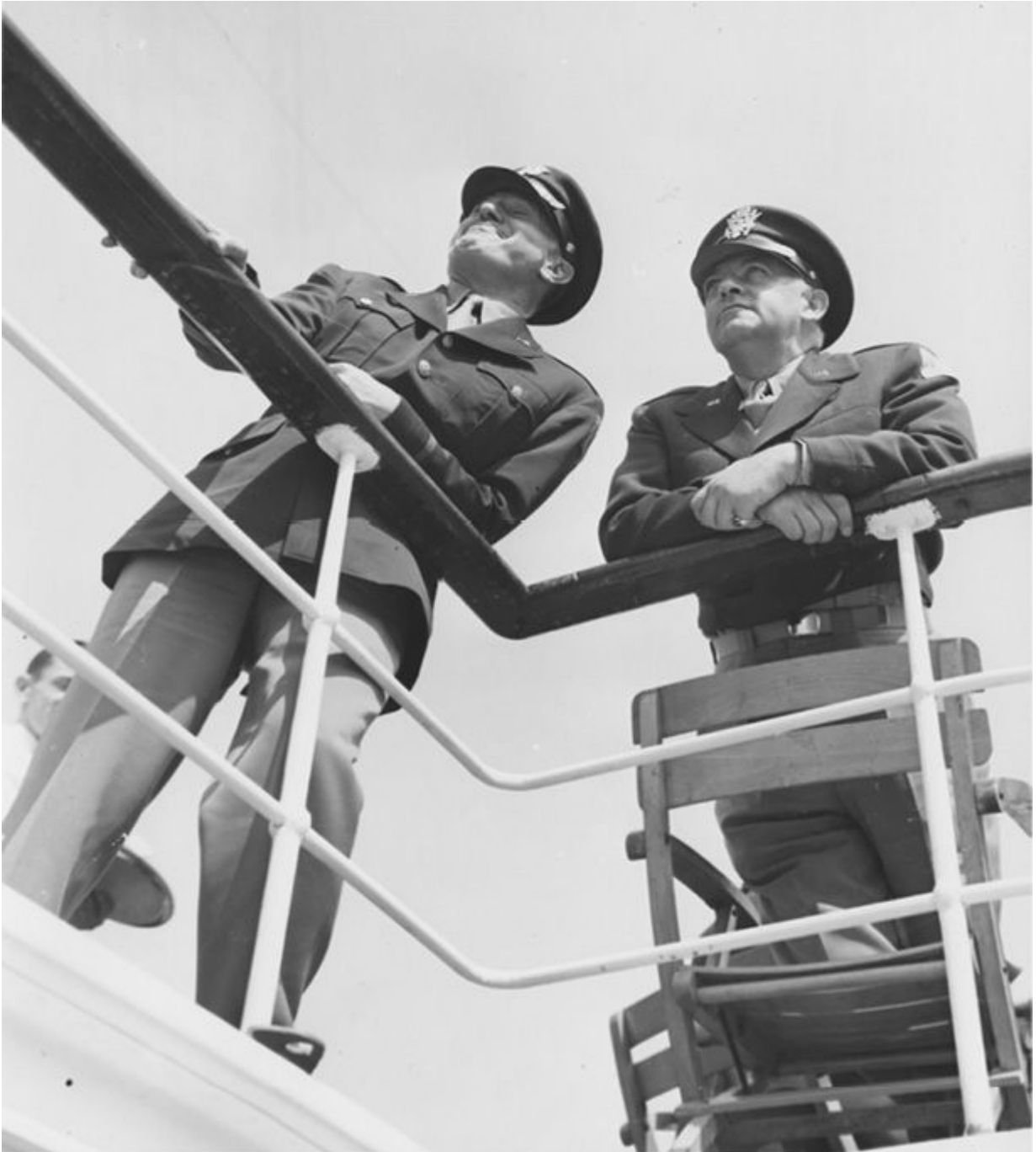
(E-D) o senhor Jack Warner, produtor executivo e vice-presidente da Warner Brothers, e o senhor Harry Cohn, presidente da Columbia, membros do grupo de executivos de cinema americano em viagem pelo continente, observam a paisagem da amurada durante uma viagem pelo Reno no iate pessoal de Hitler.