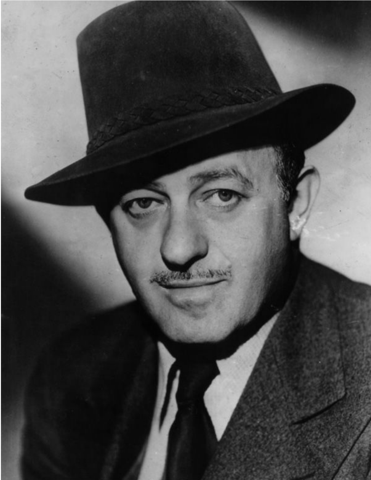
Ben Hecht, roteirista e ativista judeu.