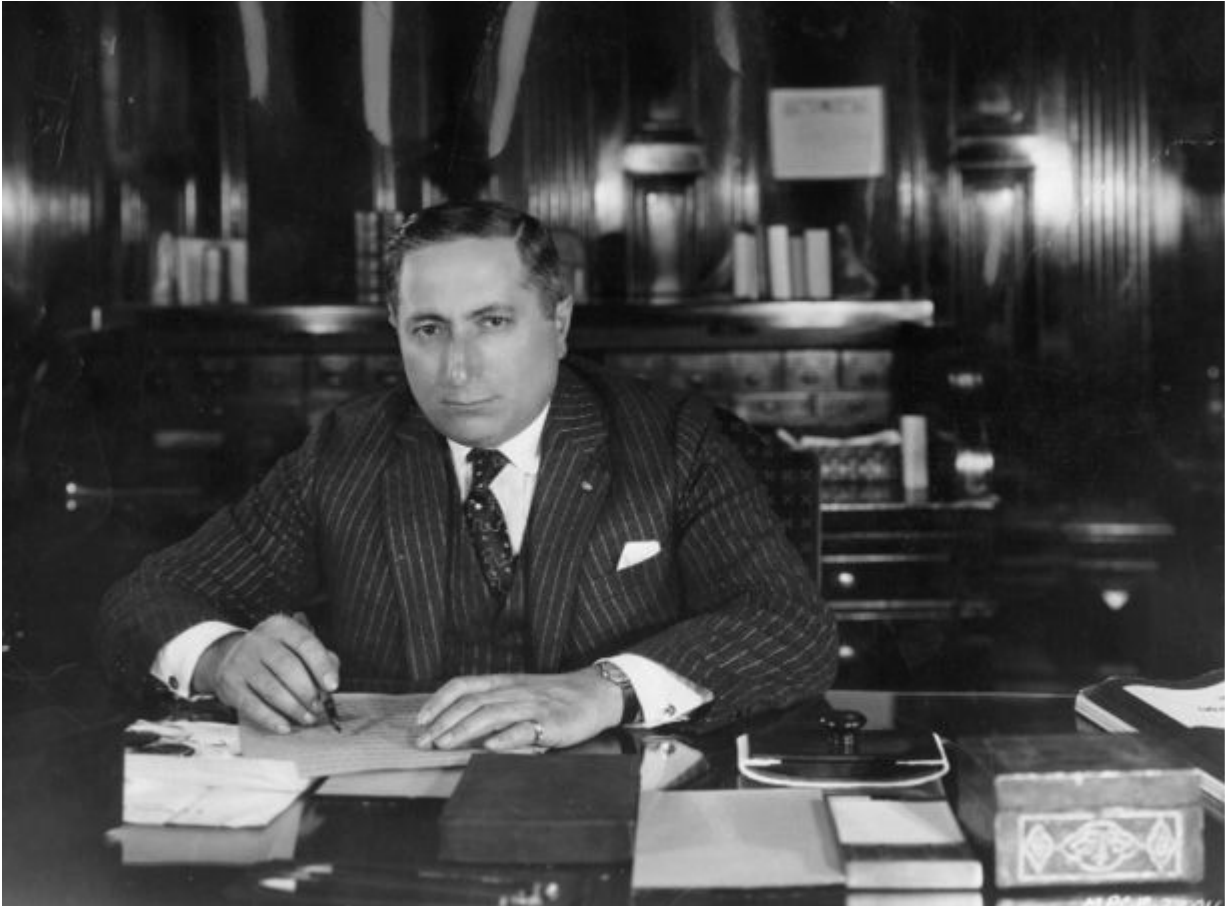
Louis B. Mayer, presidente da MGM.

Como se não bastasse, o segundo item da lista pedia que todos os ataques implícitos aos nazistas fossem também removidos. No início do filme, Lenz, o mais politizado dos três camaradas, expressa sua preferência por uma ideologia diferente. “Há outras coisas para se lutar – além de comida – além de paz”, ele grita. “Democracia – liberdade – uma nova Alemanha! Será que não vale a pena lutar por isso? ” 745 As instruções relativas a esses sentimentos expostos no filme eram claras: “vamos suprimir as referências a ‘democracia’ nas cenas 3, 31 e 75”. De novo, os executivos da MGM concordaram. 746