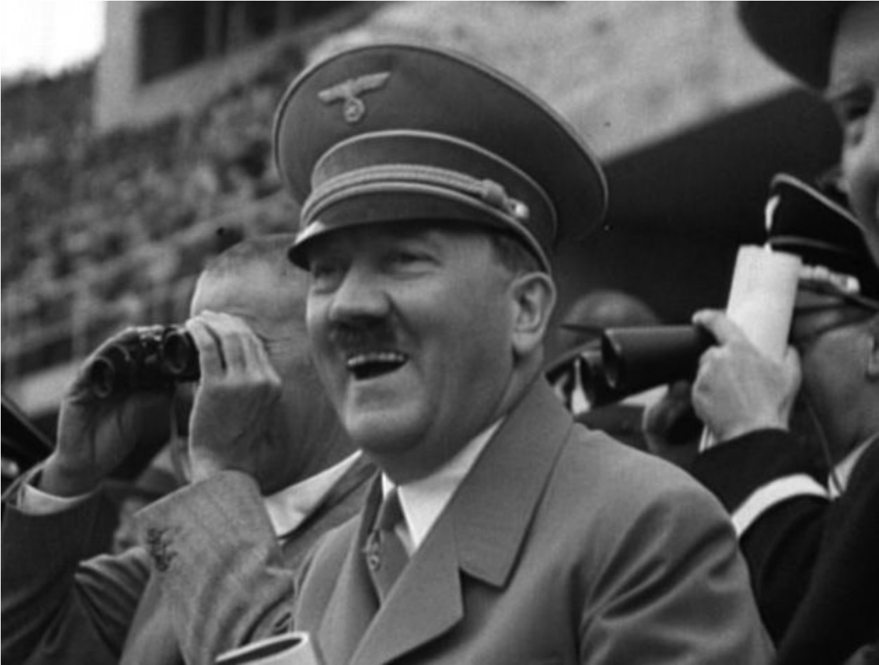
"Bom": Hitler reage positivamente a um arremesso de martelo vencedor feito por um atleta alemão nos Jogos Olímpicos de Berlim de 1936. Fotograma do filme Olympia , de Leni Riefenstahl (1938).

Hitler continuou a supervisionar o esforço de propaganda quando as hostilidades começaram de fato. Pelo menos durante o primeiro ano da guerra, promoveu mudanças nos noticiários antes que fossem exibidos. Suas habilidades como orador mostraram-se especialmente úteis, pois ele editou as narrações que acompanhavam as imagens. Mas essas suas mudanças apresentavam poucas surpresas. Ele continuou corrigindo a tendência do Ministério da Propaganda de fazer grande alarde toda vez que ele aparecia na tela. Pegou uma caneta e cortou todas as referências à sua genialidade militar, deixando apenas as menções mais sucintas, como: "O Führer com seus generais no quartel-