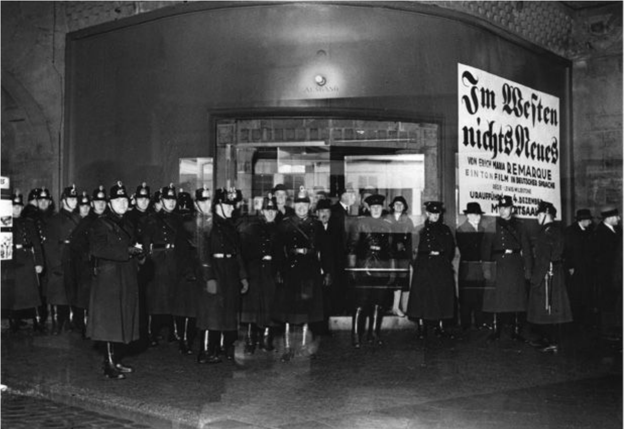
Policiais em guarda em frente ao Mozartsaal em Berlim, após o motim nazista contra All Quiet on the Western Front .

Nos dias que se seguiram, as ações dos nazistas obtiveram um apoio popular significativo. Tudo parecia a seu favor. Logo após os distúrbios, no sábado, 6 de dezembro, a questão foi levada ao Reichstag, e um representante do Partido Nacionalista Alemão apoiou Hitler. No domingo, All Quiet on the Western Front foi retomado no Mozartsaal sob forte proteção policial e, na segunda-feira, os nazistas reagiram com mais manifestações. Na terça-feira, tanto a Federação Alemã de Proprietários de Cinemas como a principal entidade estudantil da Universidade de Berlim se pronunciaram contra o filme. Na quarta-feira, o chefe de polícia de Berlim, Albert Grzesinski, que era social-democrata, decretou uma proibição de quaisquer manifestações ao ar livre, e o principal jornal nazista respondeu "Grzesinski está protegendo esse vergonhoso