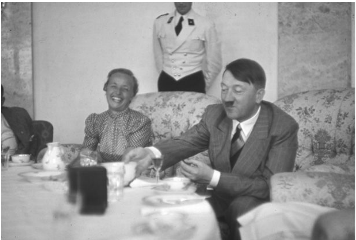
Hitler entretendo convidados num jantar na Berghof, perto de Berchtesgaden (1939).

Isso levava à segunda categoria: "ruim" ( schlecht ). Ele dizia que um filme era "ruim", "muito ruim", "especialmente ruim" ou "extraordinariamente ruim". 32 Usava palavras como "repulsivo" ou expressões como "a mais poderosa das porcarias". 33 Ele destacava certos atores: "ruim, particularmente o Gustaf Gründgens", "não gostei por causa do mau desempenho do Gründgens". 34 Em outras ocasiões, lamentava que o talento do ator havia sido desperdiçado: "Imperio Argentina: muito bom; direção: ruim". 35