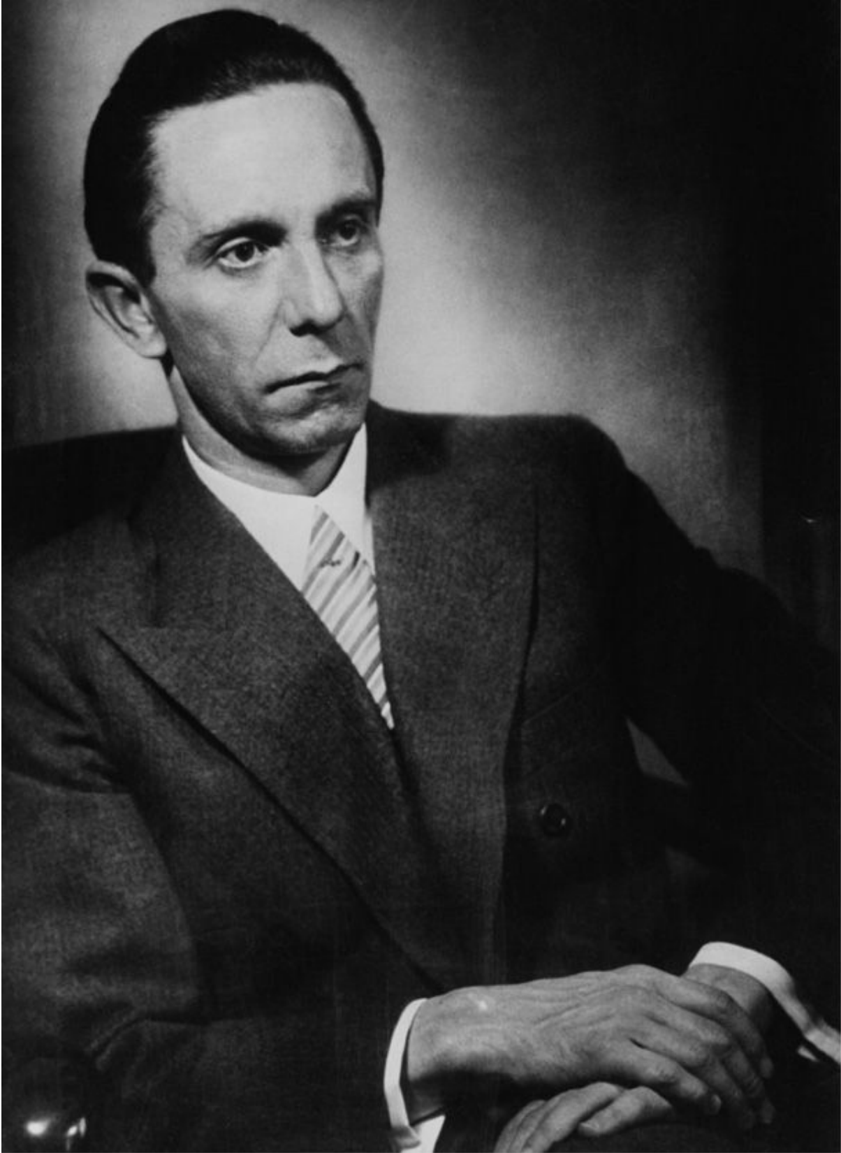
Joseph Goebbels, chefe do Ministério da Propaganda.