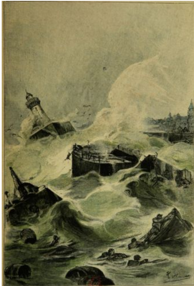
DISTÚRBIOS NO PACÍFICO