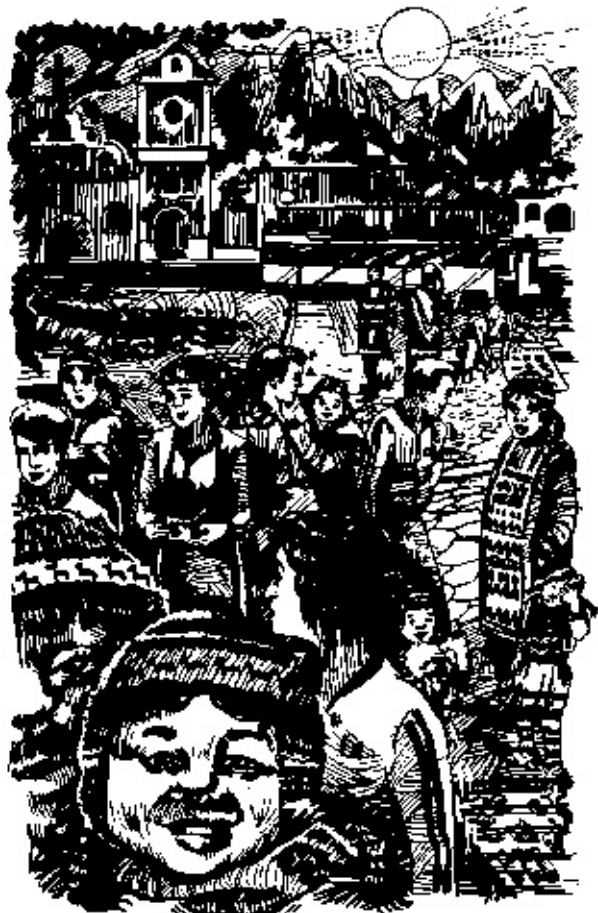
Nas ruas de Lima a equipe do Baleia Azul cruzou com muitas índias e índios. E sempre que podia, fotografava-os.